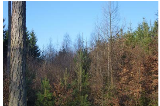
Abb. 1: Vitale junge Lärche in einer Naturverjüngung – ein Waldbau mit tiefen Kosten hat auch tiefe Risiken.

Das eher ozeanische, feuchte, warme, teilweise neblige Aargauer Klima ist für die Lärche nicht optimal. Die Kombination mit kalkreichen Standorten ist oft problematisch; so gibt es im Aargauer Jura auf Kalk nur wenige Lärchen. Auch die verbreitet sehr wüchsigen, basenreichen Standorte im Aargauer Mittelland sind problematisch. Aufgrund von Klima und Boden sind Lärchen-Pflanzungen oft wenig vital und fallen nach einigen Jahrzehnten aus. Auch ist der Pflegeaufwand aufgrund der sehr wüchsigen Edellaubhölzer und Buchen hoch. Hans Leibundgut, von 1940 bis 1979 Waldbau-Professor an der ETH, hat im Lehrwald am Zürcher Üetliberg mehrere Bestände der Mischung Lärche und Linde pflanzen lassen. Heute sind meist nur noch die Linden vorhanden. Dies zeigt die Schwierigkeiten einer «Gastbaumart» im Spannungsfeld Klima – Standort – praktische Umsetzung. Manche Ideen scheitern letztlich an der Realität, auch wenn