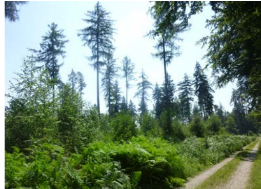
Abb. 2: Starker Schirmschlag bzw. Überhaltbetrieb im Aargauer Studenland, eine Möglichkeit, wie auf geeigneten Standorten auch Lärchen natürlich verjüngt werden können.

Aargauer Lärchen sind an den Wertholzverkäufen von WaldAargau sehr gefragt (vgl. Abb. 4). Von