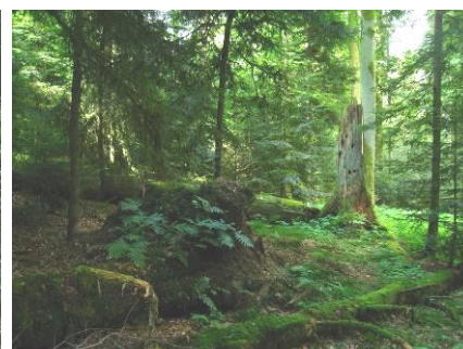
Réserve forestière totale de „Mettlenrain - Höchi“