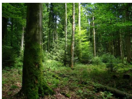
Marteloscope de Wynau-Höchi