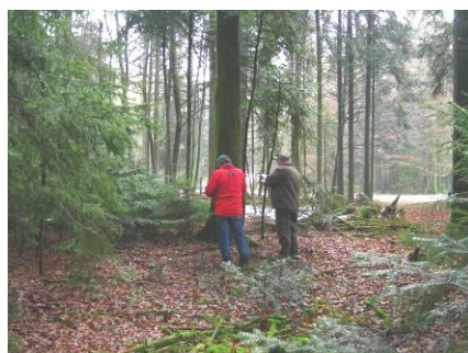
Exercice de martelage