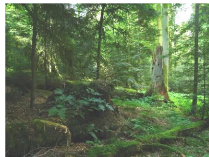
Totalreservat „Mettlenrain - Höchi“